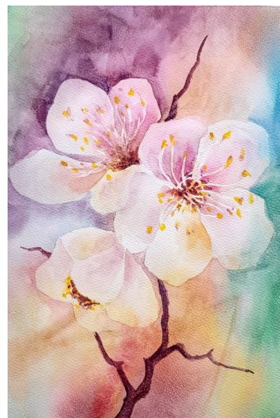
ILLUSTRATIONS NICOLE GRANGE

JE SUIS CE POMMIER FLEURI, VOUS ÊTES LA TRIBU NOMADE LA VIE S'ÉVEILLE, GLISSE LE LONG DE NOS CORPS, À BEAUPORT !